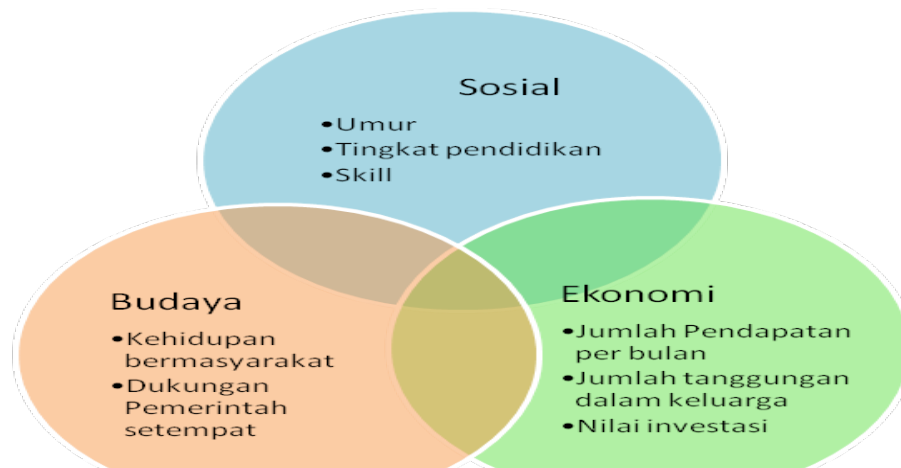
Gambar 2. Karakteristik Mantan TKI

Berdasarkan hasil analisis terhadap data mantan TKI di atas ditemukan bahwa karakteristik sosial yang di ukur dengan umur dan pendidikan. Diketahui bahwa tiga