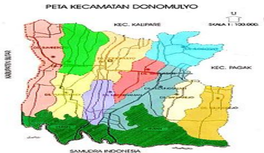
Gambar 1. Denah Lokasi Penelitian

luar negeri sangat banyak dan beragam baik ke negara Arab maupun ke Asia sendiri seperti Hongkong, Taiwan, Singapura dan Korea. Sedang wisata yang sering diunggulkan oleh kecamatan Donomulyo adalah wisata pantai dan goa diantaranya : pantai Pantai Nglurung, Pantai Modangan di desa Sumberoto, pantai Ngliyep, Pantai Jonggring Saloka, goa ular, bukit cinta kasih.